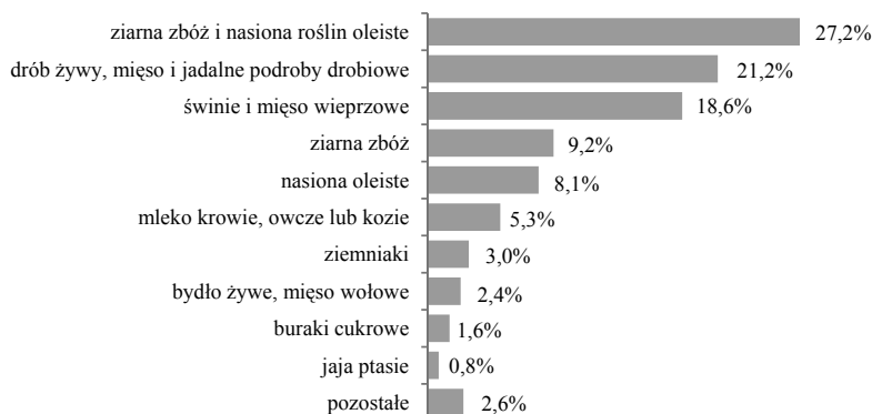
RYSUNEK 2. Struktura decyzji przyznających płatność grupom producentów rolnych według rodzaju branży